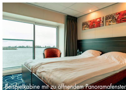
Beispielkabine mit zu öffnendem Panoramafenster